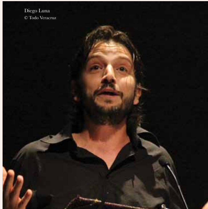
Diego Luna

Premiado con 3 Grammys Latinos, Carlinhos Brown traerá sus ritmos brasileños a Cartagena. Artista comprometido socialmente con las comunidades más desfavorecidas de Salvador de Bahía, ha colaborado con músicos como Caetano Veloso y João Gilberto. Además, formó parte del exitoso grupo Tribalistas junto con Marisa Monte y Arnaldo Antunes. Capaz de reunir a más de cien percussionistas y montar un carnaval, esta noche nos deleitará con una verdadera fiesta de ritmos.