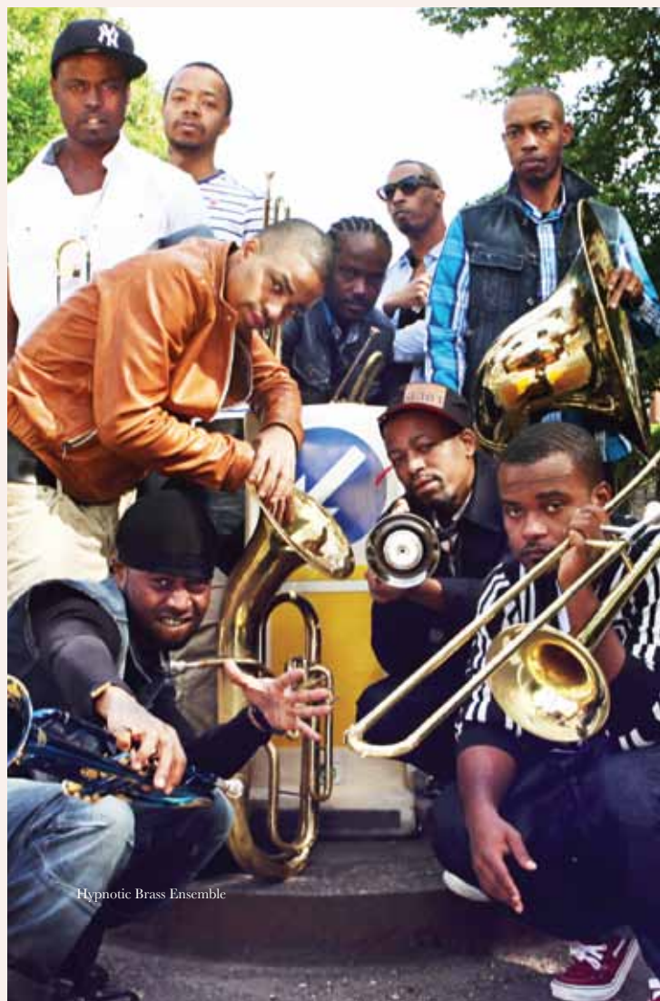
Hypnotic Brass Ensemble