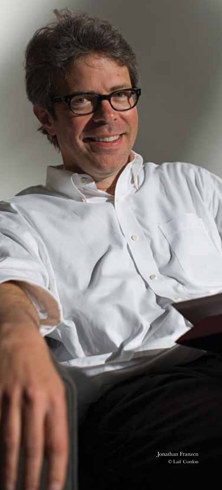
Jonathan Franzen