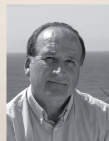
Federico Aguilera Klink